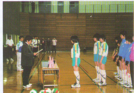
真岡市バレーボール連盟会長として