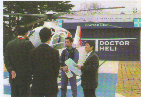
ドクターヘリを視察