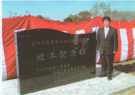
東光寺土地区画整理事業の竣工記念碑除幕式に出席