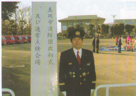
真岡市消防団第一分団長（在籍29年）