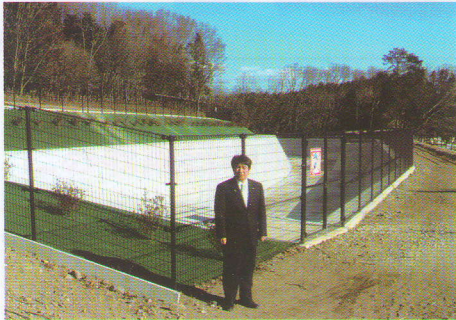
亀山北土地区画整理事業を現地視察