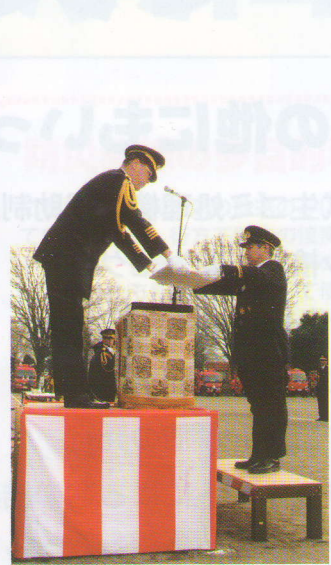
消防団員として表彰を受ける