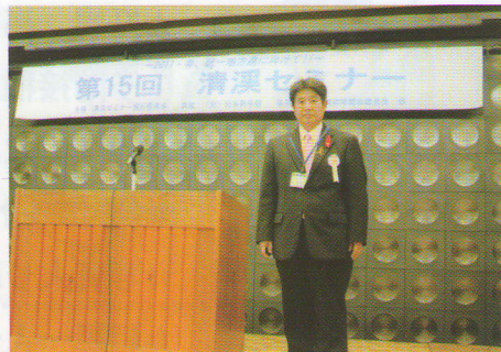
2泊3日の議員セミナーに参加（東京）