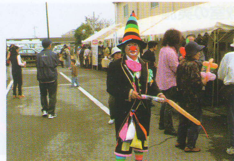
ボランティアでバルーンアート・手品を行っています